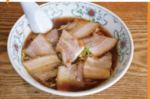
しょうゆチャーシュー