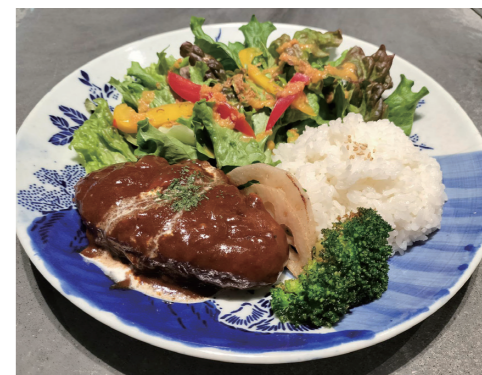
登別牛と登別豚の煮込みハンバーグ （煮込みハンバーグ/ご飯/サラダ） 1,400円

植物に囲まれ、開放感あふれるカフェ☆地元食材の登別牛と登別豚をふんだんに使用した、煮込みハンバーグ。お店で手作りするじっくり煮込んだハンバーグは、柔らかい中にもしっかりとした肉の旨味を感じ、オリジナルソースとの相性は絶品です！サラダもたっぷり添えられ、満足すること間違いなしのボリュームあるワンプレート♪非日常的な空間がひろがる店内は居心地が良く、日頃の疲れも忘れちゃう☆植物と本に囲まれながらのランチタイムは、リフレッシュできる癒しの時間♪キッズスペースもあるので、ママ会にもオススメです。気になったら、今すぐインスタグラムをチェック！