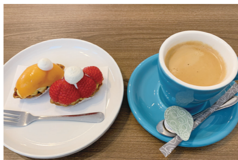
季節のタルト 1個：310円～350円 コーヒー 350円

白い壁に木目のイスとテーブル、ナチュラル感いっぱいのお店☆おすすめは、季節のタルトを食べながらのコーヒー！こだわりのタルト生地は、10時間寝かせてつくるパートブリゼ（練りパイ）！甘さ控えめ、サクサクホロホロ食感。上にのせるフルーツやクリームの水分を吸い込みにくいので、それぞれの味が引き立つというわけ♪おいしそうでしょ♡作りたてを食べて欲しいから、毎朝焼き上げています☆もちろん、タルトはテイクアウトもOK！ランチにはチキン南蛮やパスタなど、4種類のセットメニュー（サラダ・ライス・ドリンク付きで980円～）から召し上がれ！