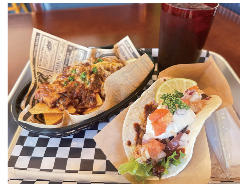
①スパイスミートタコス シングル 550円 トッピング サワークリーム +100円、ドリンク +200円 ②チーズ&ミートナチョス 850円 写真は①②合計1,700円

まるで海外にいるかのような、お洒落カフェがオープン！ハンドドリップコーヒーやカフェモカなど、定番のカフェドリンクに加え、タコライスやスパイスカレーなどを楽しめます！今回のチョイスはオーナーのおすすめ☆スパイスミートタコス/シングルにサワークリームをトッピング。肉の旨味に、すっきりとした口当たりのサワークリームが絶妙にマッチ♪そしてチーズ&ミートナチョス！パリパリのナチョスに、チーズ&ミートがよく合い、食感+食材の組合せの相性が抜群♪美味しすぎる～！百聞は一見に如かず！タコスやナチョスの美味しさを体験してみてください☆