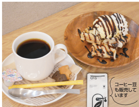
（写真） ブレンドコーヒー 500円/パッフル（チョコソース）500円 シングルオリジン 600円～ ソフトドリンク、ラテなどもあります。

コーヒーの面白さにハマってしまった店主が、スペシャルティコーヒーを気軽に楽しめるお店としてオープン☆コーヒーは好きだけど、詳しい事はわからない、コーヒーの酸味は苦手という方も、お好みの味を見つけられそう♪店主の推し、千葉県船橋市のPHILOCOFFEEAの豆は苦みが少なく、この辺りでは出会えない味！特に手間暇かけて丁寧に作られたシングルオリジン（単一品種の豆）は、今まで飲んだ事のない味との出会いに驚きます！ブレンドコーヒーやソフトドリンク、ラテもあります。テイクアウトや、豆の購入もOKなので、おうちでもコーヒーを飲みながらホッと一息、素敵な時間を♪