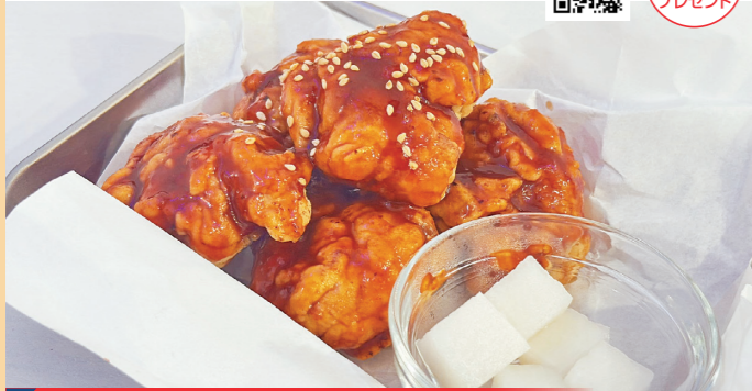
韓国チキン ヤンニョム チキンム付き/500円