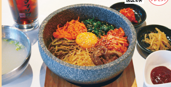
プルコギビビンバセット/830円

昨年10月、本格韓国料理を楽しむお店がオープンしました! オススメ料理は、「プルコギビビンバセット」。熱々の土鍋に具材がたっぷり入り、全部をごちゃ混ぜにして食べるビビンバは、ピリ辛味に卵黄のkokでさらに美味しさアップ☆甘みもある香ばしい味に仕上がっているので、辛さ苦手な方も美味しくいただけます! 辛気にはコチュジャンをプラスして自分好みの辛さに♪厚手の土鍋なのでおこげもシッカリついて、最後まで熱々で楽しめます! 小鉢2つにテールスープ、ソフトドリンクがついて830円とコスパ最高! 他の料理も食べてみたいな♪