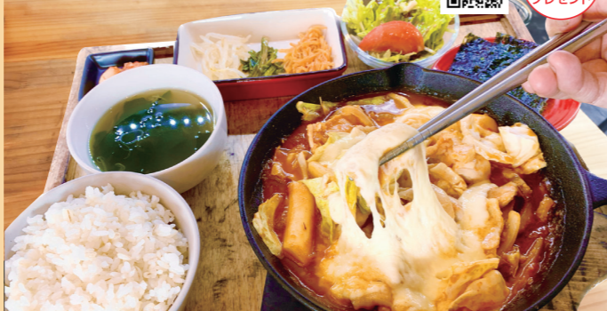
チーズタッカルビセット/1,200円

住宅街の韓国料理専門店。ソファ一席もある落ち着いた雰囲気の内なので、お子様連れにも安心。店長のおすすめは、一番人気のチーズタッカルビランチセット! 大きな鶏肉、お餅やサツマイモなどをたっぷり使った、ボリューム満点のひと品☆コチュジャンベースのソースが、また旨いんです♪とろとろチーズは直接かけても美味しいけど、一口ずつ付けて食べるのがオススメ。ソースだけの味と、チーズをかけたまるやかさと2度美味しい♪キムチやナムルサラダ、ドリンクまでついて嬉しいお得なセットです。週末には夜も営業しているので、インスタをチェックしてみて☆