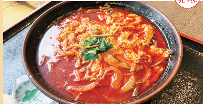
ユッケジャンラーメン/920円 ユッケジャンラーメンセット (ライス、サラダ、ドリンク付) 980円※ランチのみ

かなり手強そうな真っ赤なスープ。だけど、実際頂くと、玉ねぎや椎茸、大根などの野菜の甘みと牛肉の旨み、そこに溶きたまごが入り、まるやかな辛さのスープに仕上がっています☆単品は920円、でもランチセットにすると、ライス・サラダ・ドリンク付きで980円! 絶対お得です!! 腹ペコの欲張りさんには、ユッケジャンラーメンと半丼セットがおすすめ♪しかも4種類(焼肉丼・カルビ丼・ビビンバ丼・キムチチャーハン)の中から選べて、セットで1,150円! お子様クッパセット(600円)もあるから、親子で韓国料理を楽しめます♪専用駐車場も有るからお車でも安心☆