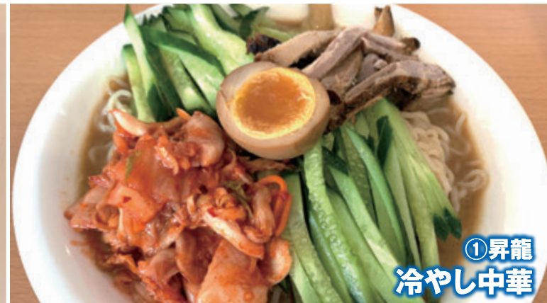
① 昇龍 冷やし中華