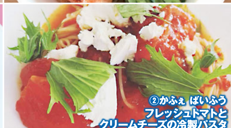
② かふえ ばいふう フレッシュトマトと クリームチーズの冷製パスタ