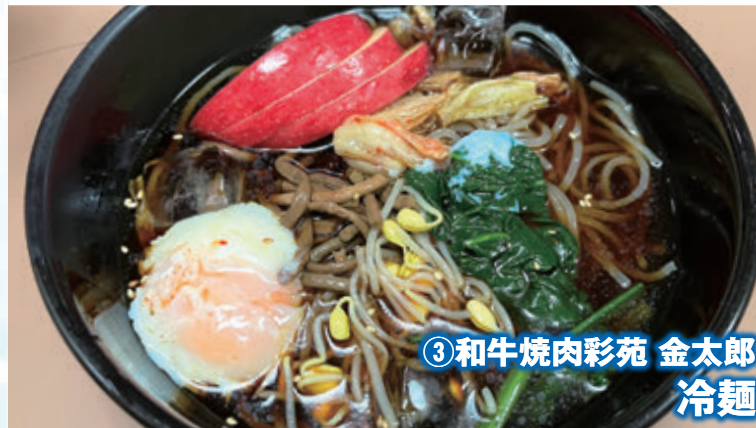
③ 和牛焼肉彩苑 金太郎 冷麺

お店に張り出されるこのフレーズにワクワクする方も多いのではないのでしょうか？！ この時期ならではの美味しさをたっぷり味わって、お疲れモードの体をすっきりサッパリさせましょう！