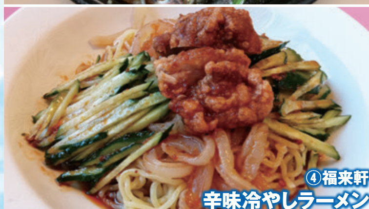
④ 福来軒 辛味冷やしラーメン