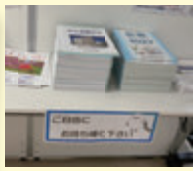
正面受付など各所に設置中