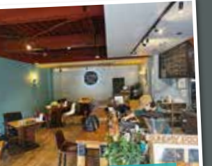
インテリアから小物まで 店長こだわりがいっぱい!

ORIGINAL DOGセット 1,050円(税込) ケチャップとマスタードのホットドッグに サラダとポテトクリーム、ドリンクがついたセットです