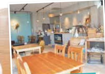
広くて落ち着いた雰囲気に、 温みを感じる木のインテリア。

オレオチョコベリー.....1,060円(税込) 軽くて甘さ控えめのクリームにふわふわのパンケーキ