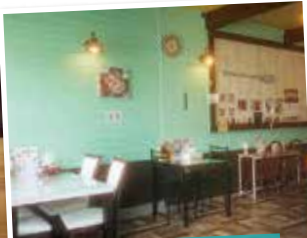
レトロポップ アメリカン風の店内。

キノコたっぷりオムライス 1,000円(税込) バナナホイップクレープ.....500円(税込)