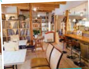
昭和初期の古民家をリノベーション 店長のこだわりが詰まった空間。