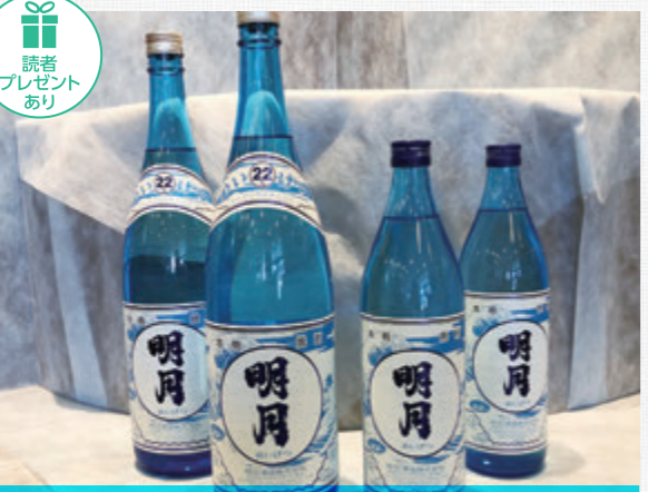
本格芋焼酎 明月(めいげつ) 夏ボトル 720ml / 1,080円(税込) 1.8ℓ / 2,000円(税込) アルコール/22度、原料/芋(黄金千貫)、米麴