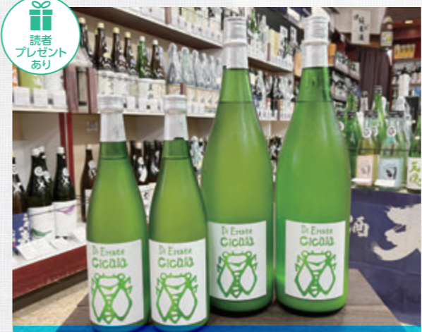
夏純吟Cicala(チカーラ)にごり 720ml / 1,430円(税込) 1.8ℓ / 2,860円(税込)