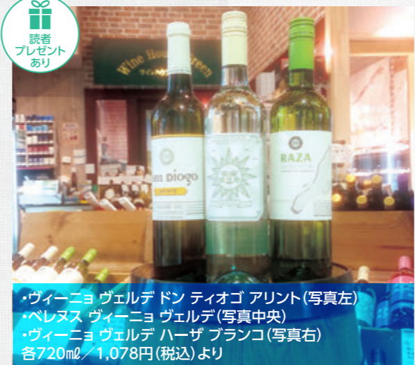
・ヴィーニョ ヴェルデ ドン ティオゴ アリント(写真左) ・パレヌス ヴィーニョ ヴェルデ(写真中央) ・ヴィーニョ ヴェルデ ハーザ ブランコ(写真右) 各720ml / 1,078円(税込)より