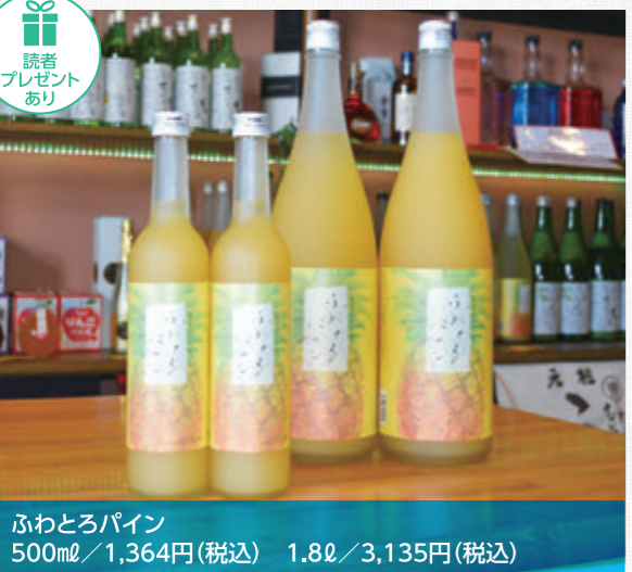
ふわとろパイン 500ml / 1,364円(税込) 1.8ℓ / 3,135円(税込)