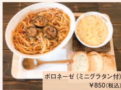
ポロネーゼ (ミニグラタン付) ¥850(税込)