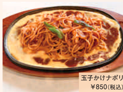
玉子かけナポリ ¥850(税込)

住所：室蘭市中央町3-2-12 ☎0143-24-3023 営業時間：10:00～20:00 定休日：不定休