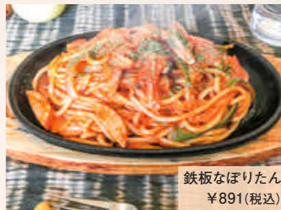
鉄板なぼりたん ¥891(税込)

住所：室蘭市中央町2-9-3 ☎080-6069-7525 営業時間：11:30～25:00 定休日：木曜日