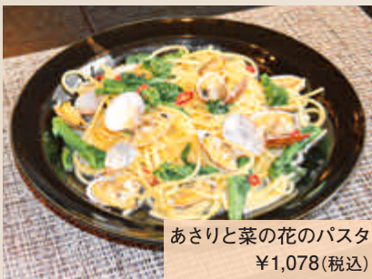
あさりと菜の花の Pasta ¥1,078(税込)

住所：室蘭市八丁平2-28-17 ☎090-5076-5660 定休日：日曜日・月曜日 営業時間：18:00～22:00 (ラストオーダー21:00) ランチは応相談 (事前連絡)