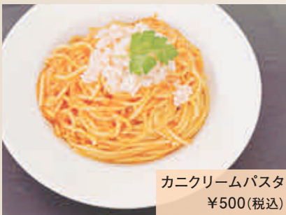
カニクリームパスタ ¥500(税込)