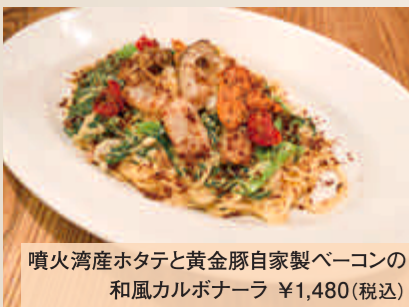
噴火湾産ホタテと黄金豚自家製ベーコンの和風カルボナーラ ¥1,480(税込)