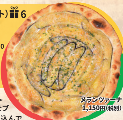
メラシツァーナ 1,150円(税込)

薄生地が特徴のミラノピッツァ。小麦はイタリア産と北海道産をブレンドし、毎日お店で生地を仕込んでいます☆高温の薪窯で焼き上げると、サクサクな歯ごたえとモチモチ感、ダブルの感動食感に! 具材は伊達産のナスと、モッツアレラチーズ。そこにナスのピューレを塩やオリーブオイルで味付けしたソースをかけるという、すみずみナスのピッツァなんです♪チーズの旨味たっぷりののに、あっさりしていて年配の方にも人気☆30cmと特大ですが、軽く食べちゃえます♪