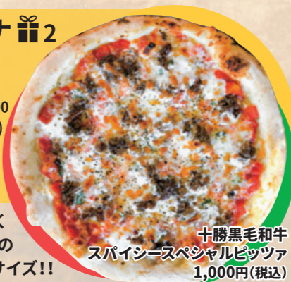
十勝黒毛和牛 スパイシースペシャルピッツァ 1,000円(税込)

定休日:月曜日(祝日の場合は営業) サイト:www.cari-na.com ☆テイクアウト出来ます。 (ピザ1枚につき別途箱代110円)