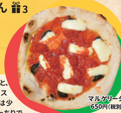
マルゲリータ 650円(税別)

時間:11:30~17:30 定休日:第2・第3水曜日 ☆テイクアウト出来ます。