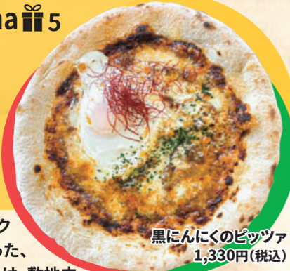
黒にんにくのピッツァ 1,330円(税込)

敷地内で栽培しているニンニクやジャガイモなどの野菜を使った、自然派ピザ♪黒にんにくピッツァは、敷地内で採れたニンニクを黒ニンニクに加工し、ソースに使用。焼いている過程で半熟卵をトッピングするひと手間が、美味しさのヒミツ☆トロ口卵と黒ニンニクのコクがベストマッチしたピザなんです♪他にもカプリチオーザ、マリナーラもあって、どれもオススメ☆じっくり炒めて玉ねぎの甘さを引き出したコクのあるnima焼きカレーや、1日20食限定の自然食メニューも見逃さない♪