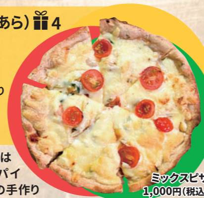
ミックスピザ 1,000円(税込)

※時間はコロナ状況により変動あり 定休日:不定休 ☆テイクアウト出来ます。 (ピザ1枚につき別途箱代50円)