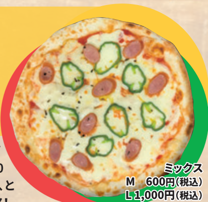
ミックス M 600円(税込) L 1,000円(税込)

リーズナブルなところが嬉しいピザは、約20cmのMサイズで600円!ちょっと1人で食べたいな、と思ったら満足できるサイズと価格!今回いただいたのはミックス。ソーセージと玉ねぎ、ピーマンが入ったシンプルなピザで、手作りの生地はもちもち食感♪注文してから生地を伸ばして焼き上げます☆マルゲリータ、ソーセージツナコーン、しめじとベーコンの4種類から召し上がれ♪フードコートなので、ソーシャルディスタンスが保たれて、密閉空間ではないため安心して食事ができます☆テイクアウトもOK!