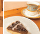
La Saint Valentin 2月限定 ¥500(税込)

緩やかなスロープを上りドアを開けるとコーヒーの香りが漂うウッドトレーラーハウス。木の温もりを感じる席でゆっくり本を読みたくなる空間です。 札幌・徳光珈琲から取り寄せた最高品質の豆で淹れるスペシャルティコーヒーは、本来の味を引き出すためハンドドリップで一杯ずつ丁寧に注がれます。雑味がなくサラサラと飲める驚きのマイルド感! カフェインレスコーヒーと厳選された茶葉の紅茶も深い味と香りが人気です。 道産小麦100%の自家製パン・スイーツ・ランチは伊達産野菜と道産食材のみというこだわり! アーモンドクリームとルバームジャム、クーベルチュールを使用した限定メニュー「La Saint Valentin(ラ・サン・ヴァロントラン)」とスペシャルティコーヒーを一緒にどうぞ♪