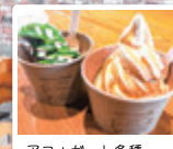
アフガート各種 エスプレッソ/¥550 お抹茶/¥600 (各税込)

登別駅前通りに昨年7月OPEN♪ 地元の魅力を広めている素敵なソフトクリームメインのカフェです。 のぼりべつ酪農館のグラスフェッドミルク100%と、じゃがいもでんぷんから作る水飴を合わせただけの無添加アイスは、牛乳本来の味と自然な甘み、粘り気のあるしっとりとした食感で外国人観光客も絶賛! イチオシはアフガートで濃い目のエスプレッソやお抹茶の苦みは大人の味として大人気です。 ゲストハウスの食事スペースでもあるので、宿泊者以外の方も自前の食品を持ち込んでOK! ソフトクリーム・コーヒー・ラテと一緒に気軽にテーブルを利用してね♪ 週替わりカレーランチのトマトチキン・鹿肉キーマ各¥800(税込)もおススメ!