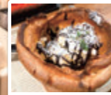
ダッチベイビー 冬季限定 ¥700(税込)

ちょっと隠れ家的な窓のないお部屋で、時間を気にせずゆっくりお茶しませんか♪ ニセコ高野珈琲店の森ブレンド・風ブレンドを味わいながら、手作りのマフィンやスコーン(テイクアウト可)など日替わりスイーツが楽しめます。ドイツのパンケーキ「ダッチベイビー」があるのも、とても魅力的♥外はシュー生地のようにサクッ、中はフワッとしていてバニラアイスとチョコバナナがのったボリュームミーな大きさ♪ ランチではガパオライスやモチモチ太麺のナポリタンが昔懐かしい味と大評判! お食事以外にも、悩んでいる時にアドバイスをくれるオラクルカード占い・リーディングが人気です。(ランチタイム以外30分¥3,000)