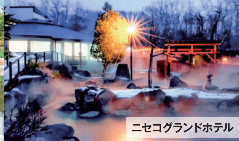
ニセコグランドホテル