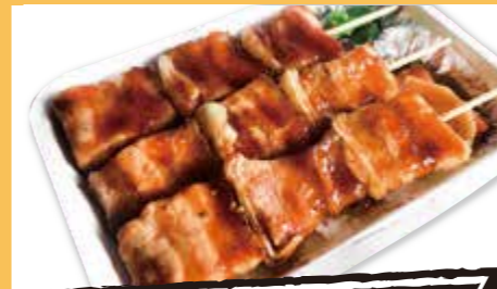
むろらん焼とり弁当(バラ3本入り) ¥500 (税込)

お昼ご飯に悩んだら宅配弁当はいかが☆ ホテル自慢のボリューム満点のステーキ弁当がこの秋のオススメ! ステーキはもちろんコロッケ、パスタ、グラタンなど贅沢なおかずで価格は超お得!他にも海鮮ぶっかけ丼、エビチリ&チャーハン等、全部で9種類もあるので目移りしちゃっ!11月だけのメニューです。その日の気分で注文しよう!