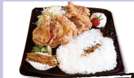
唐揚げ弁当 ¥600 (税込) ※料金は変更になる場合がございます。