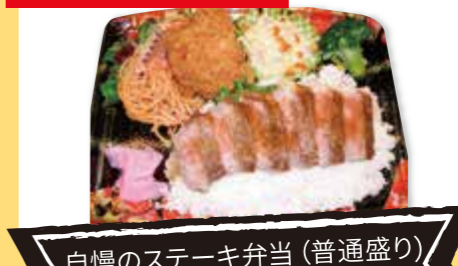
自慢のステーキ弁当(普通盛り) ¥500 (税込)