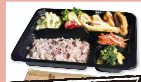
週替わり弁当 ¥650 (税込)