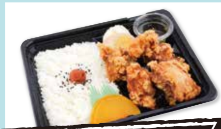
札幌ザンギ弁当 ¥550 (税込)