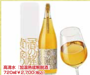
高清水「加温熟成解脫酒」 720ml ¥2,700(税込)

抽選で2名様に当たる!! ④ 当店で使える1,000円券をプレゼント。詳しくはプレゼント券をみてネット!