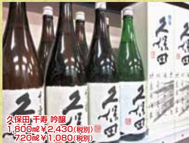
久保田千寿吟醸 1,800ml ¥2,430(税別) 720ml ¥1,080(税別)