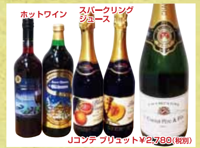
Jコンテ プリュエット ¥2,780(税別)