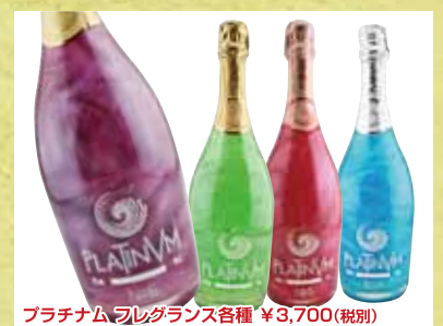
ブラチナム フレグランス各種 ¥3,700(税別)