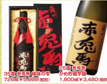
35度 赤兎馬 極味の雫 720ml ¥5,100(税別) 25度 赤兎馬 かめ貯蔵芋麹 1,800ml ¥3,480(税別)

抽選で2名様に当たる!! ⑤ 当店で使える1,000円券をプレゼント。詳しくはプレゼント券をみてネット!