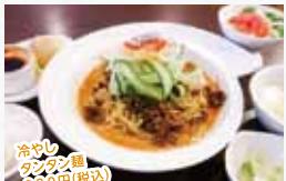
冷やし タンタン麺 880円(税込)