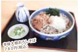
辛味大根おろしそば 780円(税込)