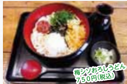
梅シソおろしうどん 750円(税込)