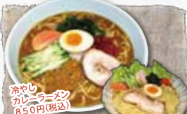
冷やし カレーラーメン 850円(税込)