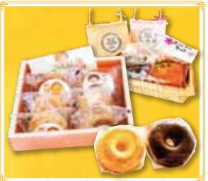
げんこつパイ カスタード・チョコ 各173円(税込) モンパリセット 572円(税込)

さて4月です!新学期・新年度のはじまり♪ 「ご挨拶や何かのお礼など、よそのお宅を訪問する機会が増える時期ではないでしょうか。その時にちょっとした気の利いた手土産を携えて訪問すると、緊張がほぐれて先方も話しやすくなりますよ。お菓子は笑顔を運ぶ♪なんてCMが昔あったような、なつかしい時間を作ってください。普段使いのおやつにもどうぞ召し上げられ、だけじゃなく心も暖ませ、優しい時間を作ってください。普段使いのおやつにもどうぞ召し上げられ、