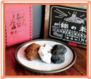
鐵の素クッキー(各税込) 15個入(7枚装) 980円 24個入(7枚装) 1,680円・36個入(黒箱) 1,980円

▲ 登別市中央町4丁目11 ☎ 0143-88-1286 🕒 10:00-20:00 ☑ 第一・第三木曜日