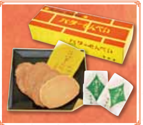
バター煎餅・チーズ煎餅 4枚×12個入 各702円(税込)

▲ 室蘭市御前水町1丁目13-2-2 ☎ 0143-23-7765 🕒 10:00-19:00 ☑ 毎週火曜日 🌐 http://kashikoubu-monpari.com/