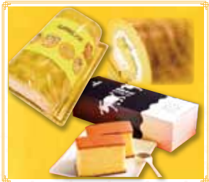
のぼる 1本 1,242円(税込) 登別牛乳カステラ 1斤 1,380円(税込)

▲ 伊達市末永町4-9-6 8 ☎ 0142-23-3672 🕒 9:00-18:00 ☑ 日曜日(お盆・お彼岸・年末は営業致します)