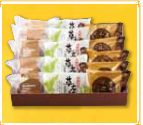
バラエティセットB 2,975円(税込) 草太郎5個・千寿菓5個・マールケーキ2個・マドレーヌ8個セット

▲ 室蘭市中央町2丁目9-4 ☎ 0143-22-5455 🕒 8:00-19:00 (中島店は10:00-18:30) ☑ 不定休(中島店は水曜日)