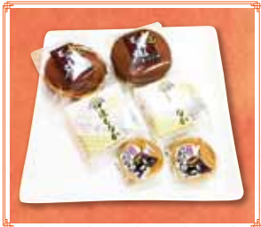
伊達どら焼き・伊達もなか 各130円(税込) 伊達かぶとまんじゅう 98円(税込)