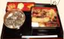
ハモ重 ※1日数量限定 1,200円(税込)