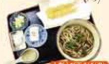
十割えび天そば(温) 1,000円