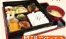
特製日替りランチ(ローヒ〜サ) 700円(税込)