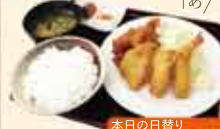
本日の日替り 730円(税込)