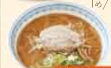
味噌ラーメン 670円(税込)