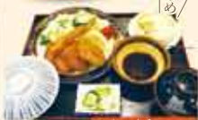
レディス定食 700円(税込)