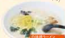
白味噌ラーメン 500円(税込)