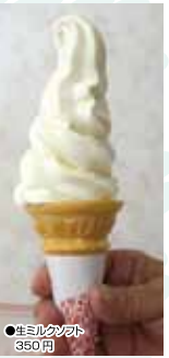
生ミルクソフト 350円

ソフトクリームは12種もありません。人気のソフトクリームは、濃厚なミルクの味の「生ミルクソフト」そして洋ナシの香り漂う「フランクソフト」です！サイスほちびつから大盛りまで各種あり、なんと2種類を味わえるツインソフトもオススメ☆他にもお持ち帰り用のケーキやソフトクリームまでありますよ！施設内では、犬・猫・うさぎなどの動物との触れ合いや、土日祝日限定のバギーバイク、親子で楽しめるパークゴルフなどもあり！楽しくなる施設ですので、お子様連れでも是非！