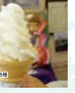
ソフトクリーム各種 250円(税込)

白鳥大橋記念館「みたら」道の駅、広々とした明るく開放感たっぷりの休憩スペースは、ロケーションが最高！白鳥大橋や大黒島を望みながら、施設一番人気「北海道ソフトクリーム」を食すのは、なんて気分がいいんでしょう！道内産牛乳をたっぷり使いた、生クリームを贅沢に使用しているのをお天気のいい日は「みたら」でのごんびり！