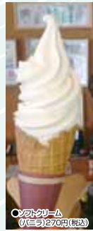
ソフトクリーム 0(三喜)270円(税込)

ばんこつパイなどの洋菓子で有名な「菓子工房モンパリー」のソフトクリームは、牛乳本来の味に近いやさしい・甘さで後味もバツリで、しかもなかなかのボリューム！最後までキツリ中に食べ飽きしない味になっていきますよ中にはソフトクリームだけを食べにやられるお客さんも多いとか！また、店内のイートインスペースでちょっと休憩するのもいいですよ☆これからの暑い日に、冷たくておいしい「モンパリー」のソフトクリームで涼んでみてはいかがでしょうか？