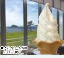
ソフトクリーム各種 260円(税込)

サンチャイルド 登別市札内町299-1 営業時間 9:00～18:00 定休日 なし 電話 0143-83-0777 URL http://sunchild.moo.jp