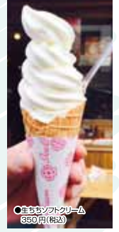
生チョコソフトクリーム 350円(税込)

白鳥大橋記念館「みたら」道の駅、広々とした明るく開放感たっぷりの休憩スペースは、ロケーションが最高！白鳥大橋や大黒島を望みながら、施設一番人気「北海道ソフトクリーム」を食すのは、なんて気分がいいんでしょう！道内産牛乳をたっぷり使いた、生クリームを贅沢に使用している為、濃厚で甘めなのに後味すっきり☆ん！自然を感じながらのソフトクリーム、癒されましょ！味はパニラ、抹茶、パニラ&抹茶の3種類。他にも、室蘭ならではの土産が各種揃っているのをお天気のいい日は「みたら」でのごんびり！