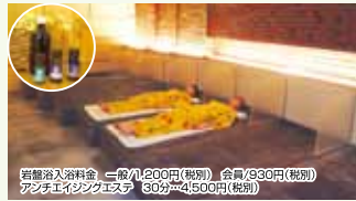
岩盤浴入浴料金 三層/丸200円(税別) 金層/330円(税別) アロマチェイティングコース 30分/4150円(税別)

イロコースマリーオイルの最強の組み合わせでフェイシャルエステ、香りのマッサージで癒されリフレッシュ、心地良くて知らぬ間に眠ってしまいます。全身にツながる顔のツボを刺激することで内臓にもアプローチして女性ホルモンを活性化してシミ・ソバカスを消滅に導きます。 るみやむきに効果あり☆オイルで血巡りを良くした後には岩盤浴で老廃物を汗とともに汗腺から排出して「いや、なんだよ」との体感。すべて終わった後はスキスリして夜はぐっすりぐっすり眠れる。この「いや」と「ぐっすり」の気持ち良さ、一度体験するとクセになっちゃうこと間違いなし！