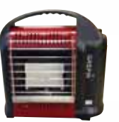
●簡易ストップ(ガスヒーター) 11,800円

また、雪が積もり、固まって氷になってしまうと転倒の危険! そんな時や、春先の氷割りにはアイスピックルがあることも便利です。 女性でもクラクラに氷が割れます。余分な力が必要としないので疲れにくく、氷が飛び散らない、路面も傷がつかない、驚くほど簡単に氷が割れます。 そして、まさかの冬の停電には救世主となる簡易ストップ(ガスヒーター)はいかが? カセットボンベを使用し、セラミック加熱板から強力な赤外線とパワーで、体全体を暖めてくれます。いざという時にはとっても便利。 とても軽くて持ち運びも手軽にできちゃうスタイル。冬のお困りはハンマーハウス ツツダでキマリ!!