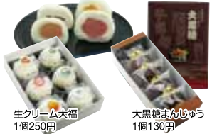
大黒糖まんじゅう 1個130円 生クリーム大福 1個250円

作り上げたオリジナルな味もついでです。おきまじゅうも通年を通して人気上昇中！よもぎの香るおまんじゅうは一度食べたらリピート間違いありません！