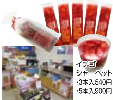
イチゴシャーベット 3本入540円 5本入900円

「またのめ」(室蘭セット)等、お得な詰め合わせもあるので、室蘭土産のスイーツはぜひ「高岡」にGO！