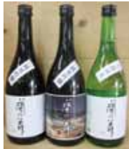
蘭の舞 純米吟醸 720ml 2,200円 室蘭純米 720ml 1,500円

室蘭の地酒をどうしても復活させたいという酒本社長の強い思いで、昭和63年に室蘭純米「蘭の舞」が誕生しました。これでしか手にしない、「酒本商店」オリジナルのお酒をご紹介します。