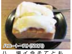
ハチノヘアイス(600円)

大人になっても学生時代のことを思い出させてくれる喫茶店、それが「胡亜羅」。今回はあえてスイーツ部門で登場です！ まず頂いたのはハチノヘアイス。1人で食べられるか心配になるほどの厚切りアイス。これが焼けたその中はトロトロ。上にはほろほろとというほどのアイスクリーム。そしてほろほろ。ああ、ハチノヘアイス。はてさてどうしてコレがコレなんだかね。うって感じ知られずすずや笑！とにかく食べなさい！食べなさい！わかちあひも！ぜひお腹空かせてトライしてください。