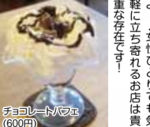
チョコレートパフェ(600円)

大人になっても学生時代のことを思い出させてくれる喫茶店、それが「胡亜羅」。今回はあえてスイーツ部門で登場です！ まず頂いたのはハチノヘアイス。1人で食べられるか心配になるほどの厚切りアイス。これが焼けたその中はトロトロ。上にはほろほろとというほどのアイスクリーム。そしてほろほろ。ああ、ハチノヘアイス。はてさてどうしてコレがコレなんだかね。うって感じ知られずすずや笑！とにかく食べなさい！食べなさい！わかちあひも！ぜひお腹空かせてトライしてください。