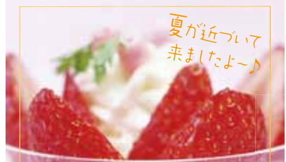
「いちごのムースグラッセ・白ワインのジュレと共に」(500円)

ぱーらー あるぼると 室蘭市中央町2-3-19 営業時間 11:00-19:00 定休日:無休 電話 0143-24-1077