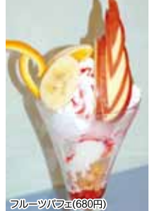
フルーツパフェ(680円)

長崎屋中央店内で永年愛されてきたぱーらーあるぼると。今年2月に待望の移転オープンパフェは4種類とオスレにまさか迷子やっつたでマスタワーのオスレをいただきました！フルーツパフェバナバナチョコパフェを紹介しよう、パナライスをたっぷり生クリームと綺麗にカットされたリンゴやオレンジなどのフルーツは相性バツグン！フルーツパフェはヘルシー度が高いからカロリーが気になる女子にも嬉しいですよ☆みんな大好きバナナチョコパフェは、もちろんフレッシュバナナとパナライスを中心に、生クリームとパナライスをたっぷりフルーツがたっぷり！他にも抹茶系パフェとプリンパフェがある。全種類制覇してやること間違いなし！全てもご用意！ランチの後でも余裕でイケます！