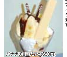
バナナチョコパフェ(650円)

長崎屋中央店内で永年愛されてきたぱーらーあるぼると。今年2月に待望の移転オープンパフェは4種類とオスレにまさか迷子やっつたでマスタワーのオスレをいただきました！フルーツパフェバナバナチョコパフェを紹介しよう、パナライスをたっぷり生クリームと綺麗にカットされたリンゴやオレンジなどのフルーツは相性バツグン！フルーツパフェはヘルシー度が高いからカロリーが気になる女子にも嬉しいですよ☆みんな大好きバナナチョコパフェは、もちろんフレッシュバナナとパナライスを中心に、生クリームとパナライスをたっぷりフルーツがたっぷり！他にも抹茶系パフェとプリンパフェがある。全種類制覇してやること間違いなし！全てもご用意！ランチの後でも余裕でイケます！