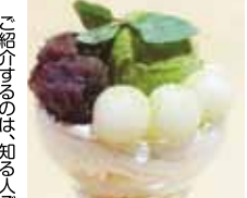
和風抹茶パフェ(263円)

ご紹介するのは知る人ぞ知る「回転寿司ちよひす」の「パフェ」です。お寿司が人気なのは、もちろんですが色々なソースを入れています。なかでも「押しは」と「和風抹茶パフェ」は、苦い抹茶のアクセントと甘さが徹底的に「和のスイーツ」自社工場で作られているのだわりのあはれは、実はあの有名な菓子「うずまき」と同じようなのです。なるほど！美味しいう理由がわかりました！