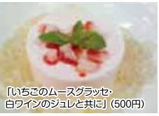
「いちごのムースグラッセ・白ワインのジュレと共に」(500円)

8月でオープンから2年を迎える「洋食屋ミラコスタ」。店内はとってもゆったりとしてお洒落な感じがGOOD！カウンター席とテーブル席とがあるため、おひとりさまランチやファミリーなど、いろいろなシーンでご利用いただけます。早く行かないと予約が必要かも！